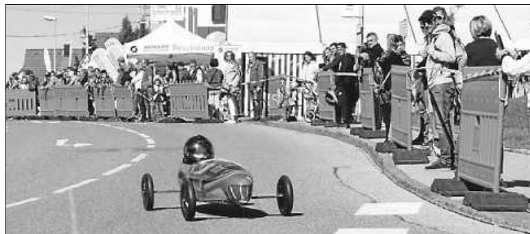
Die Seifenkisten der Firmen und Vereine lieferten sich spannende Rennen.

e.V.“, denen auch dieses Jahr wieder der Kompletterlös zugutekommt. Die Begeisterung ins Gesicht geschrieben waren den zahlreichen Zuschauern auch während der abschließenden Cruising-Runde, wo über 30 Übersee-Exoten ein ohrenbetäubendes Soundspektakel abzogen – allen voran im ersten Fahrzeug als prominentem Mitfahrer Bürgermeister André Kielack.