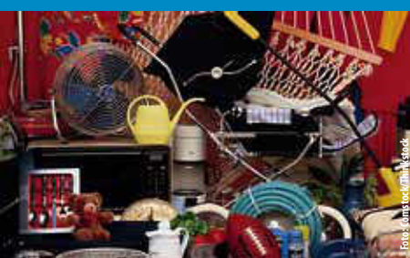
Fanfarezug Wehingen: Altmaterialsammlung