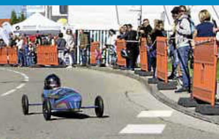
Heuberg aktiv: Seifenkistenrennen