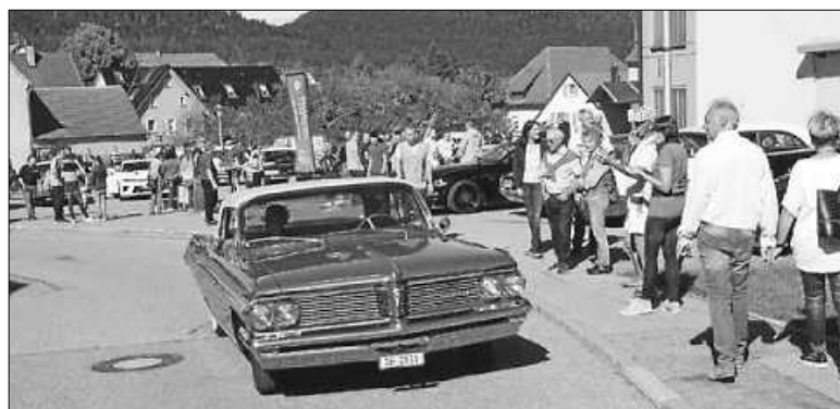
Die US-Cars lockt viele Besucher. Man konnte sogar eine Fahrt mit den heißen Schlitten gewinnen.

Spannung und Spaß waren Trumpf beim sportlichen Teil des Nachmittags, den Rennen zum dreizehnten Seifenkisten-Cup in Gosheims Dorfmitte. Trotz rasanten Fahrten, teils mit waghalsig ausschauenden Kreativgefährten oder windkanalerprobten Speedkanonen, blieben alle Piloten unfallfrei und unversehrt, wie Bürgermeister Kielack als Schirmherr bei der Siegerehrung zufrieden bestätigte. Er zeigte sich auch angetan vom technischen Aufwand, der wieder von der Wehinger Softwareschmiede Gewatec mit der vollelektronischen Startrampe inklusive personalisierter und live auf Bildschirme übertragener Zeitmessung betrieben wurde. Im Hinblick auf die gefahrenen Zeiten, wo teilweise Tausendstel Sekunden über Siegertreppchen oder hintere Platzierung entschieden, stellte der sichtlich begeisterte Ortsvorsteher beeindruckt fest: „Das könnte mit der Hand keiner mehr stoppen, das ist ja wirklich wie in der Formel 1“. Aus Kielacks Händen nahmen die Gewinner der verschiedenen Kategorien dann wertvolle Preise entgegen.