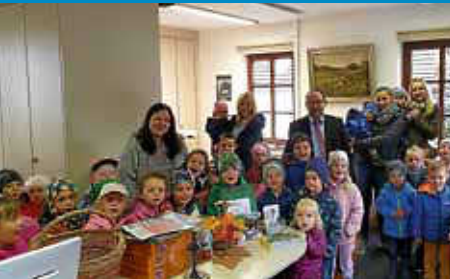
Kindergarten Egesheim gratuliert Bürgermeister