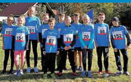
Realschule erfolgreich beim Fossiluslauf