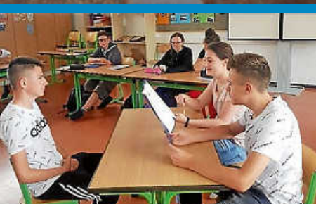
Schüler werden auf berufliche Zukunft vorbereitet