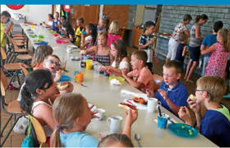
Schule - die letzten Tage vor den Ferien