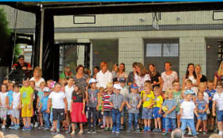
Die Kindergärten gratulieren den Altersjubilaren