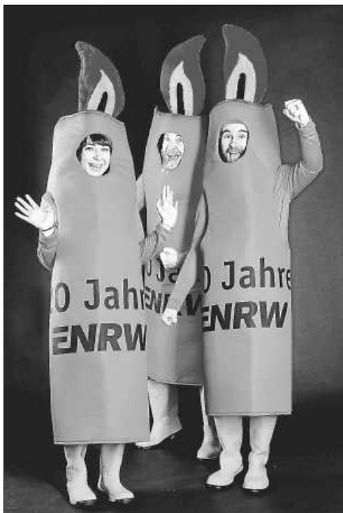
Personen im Kerzenkostüm

Die ENRW schickt 2019 im gesamten Netzgebiet 20 Geburtstagskerzen auf Tour, welche Gratis-Lose verteilen. Unterwegs sind die witzigen Kostüme beispielsweise beim Wehinger Straßenfest am Sonntag, den 7. Juli zwischen 13 und 15 Uhr. In die orangenen Kerzen schlüpfen Mitglieder örtlicher Vereine.