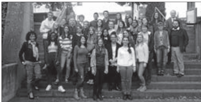
Das Foto zeigt die Austauschschüler mit ihren Begleitern beim Besuch in Luxemburg

Nun treffen sich die Schüler wieder im Juni des nächsten Jahres zum Gegenbesuch in Wehingen, um dann ihre Freundschaften weiter auszubauen und sich gemeinsam auf die Spuren berühmter Persönlichkeiten unserer Region zu machen.