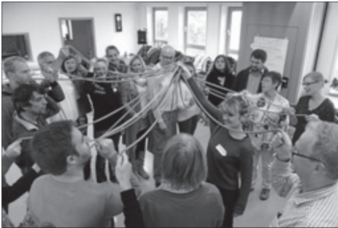
Das Foto zeigt Lehrerinnen und Lehrer des GGW bei der Fortbildung.

Entwickelt wurde das Unterrichtsprogramm von der Organisation "Quest". Gefördert wird es vom "Lions Club", der entsprechende Fortbildungen organisiert und bezuschusst. Schon seit den 1990er Jahren erproben Schulen des Landes das Programm. Aufgrund des bisherigen Erfolgs wird "Lions-Quest" vom Kultusministerium ausdrücklich empfohlen. Viele Schulen sind der Empfehlung schon gefolgt. In den letzten Jahren haben über 10.000 Lehrerinnen und Lehrer verschiedener Schularten in Baden-Württemberg "Lions-Quest"-Kurse besucht.