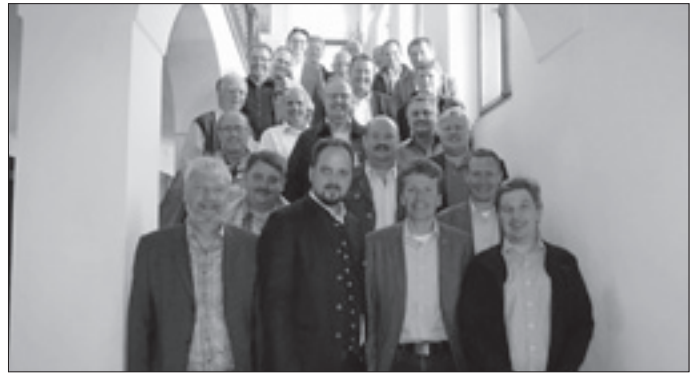
Die Bürgermeister des Landkreises zusammen mit Landrat Stefan Bär vor der Geschäftsstelle des bayrischen Gemeindetags

Hier schloss sich dann auch wieder der Reigen zu dem Besuch in Freising.