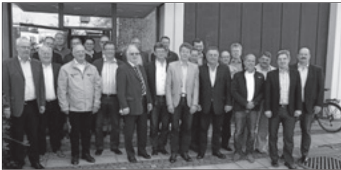
Empfang im Freisinger Rathaus mit Oberbürgermeister Tobias Eschenbacher, Freising

Bei einem anschließenden Stadtrundgang auf den Domberg verschafften sich die Bürgermeister einen Eindruck von der innerstädtischen Sanierung Freising. Derzeit arbeitet man ein Konzept zur autofreien Innenstadt.