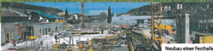
Neubau einer Festhalle