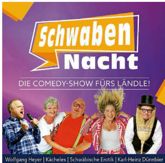
Plakat: Schwäbische Comedy

Der Kulturverein holt 2027 mit der Schwabennacht wieder vier Comedy-Künstler nach Wehingen für einen Abend voller Comedy , Kabarett und Musik , gewürzt mit allem, was das Schwabenland so liebenswert macht: viel Herz , eine ordentliche Portion Schlitzohrigkeit und Pointen , bei denen selbst die Maultaschen vor Lachen im Teller tanzen!