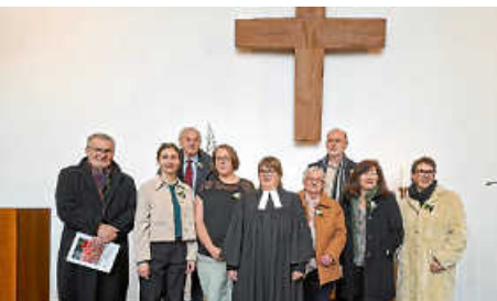
Konfirmationsjubiläum am Palmsonntag