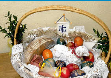
Speisensegnung an Ostern

Diese Ausgabe erscheint auch online auf NUSSBAUM.de