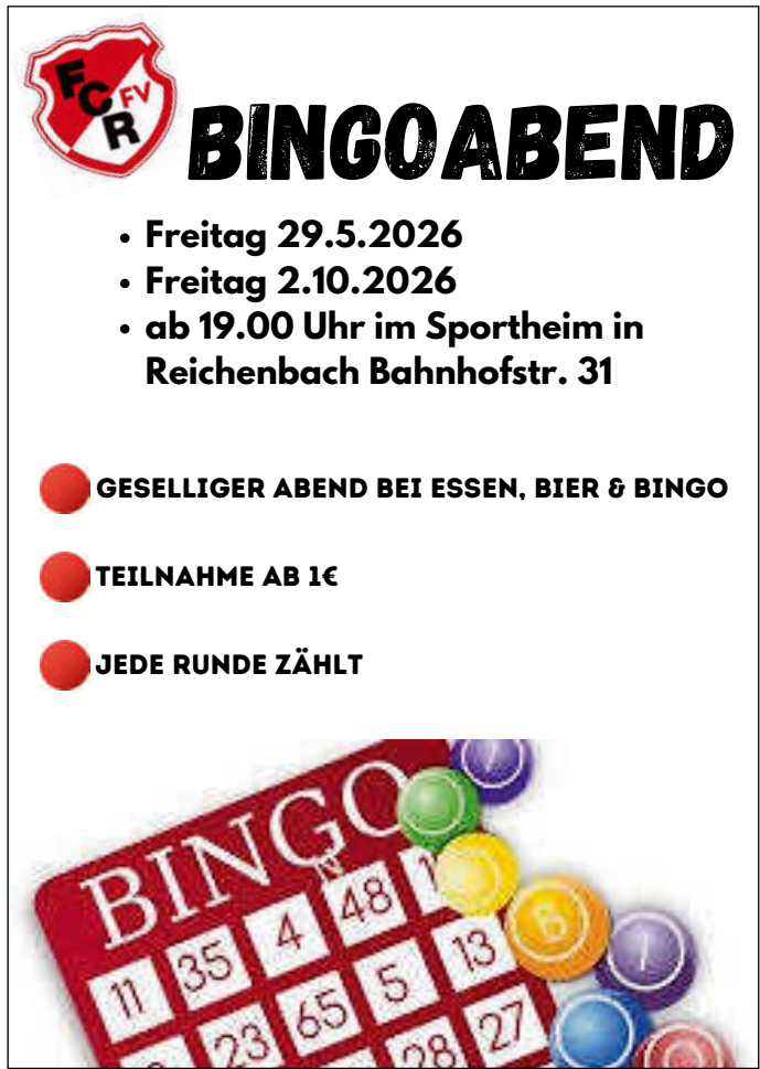
Plakat: Ayleen Bauser