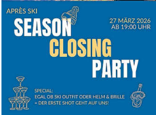
Plakat: SC Wehingen