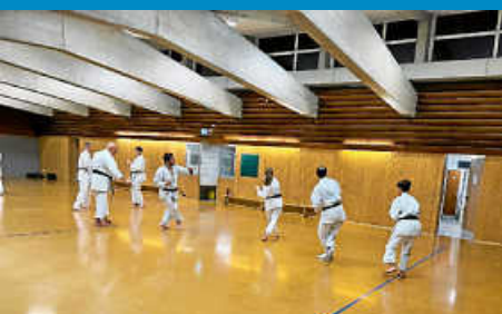
Karate – mehr als nur Kampfsport

Diese Ausgabe erscheint auch online auf NUSSBAUM.de