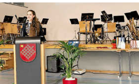
Neujahrsbürgertreff der Gemeinde Egesheim